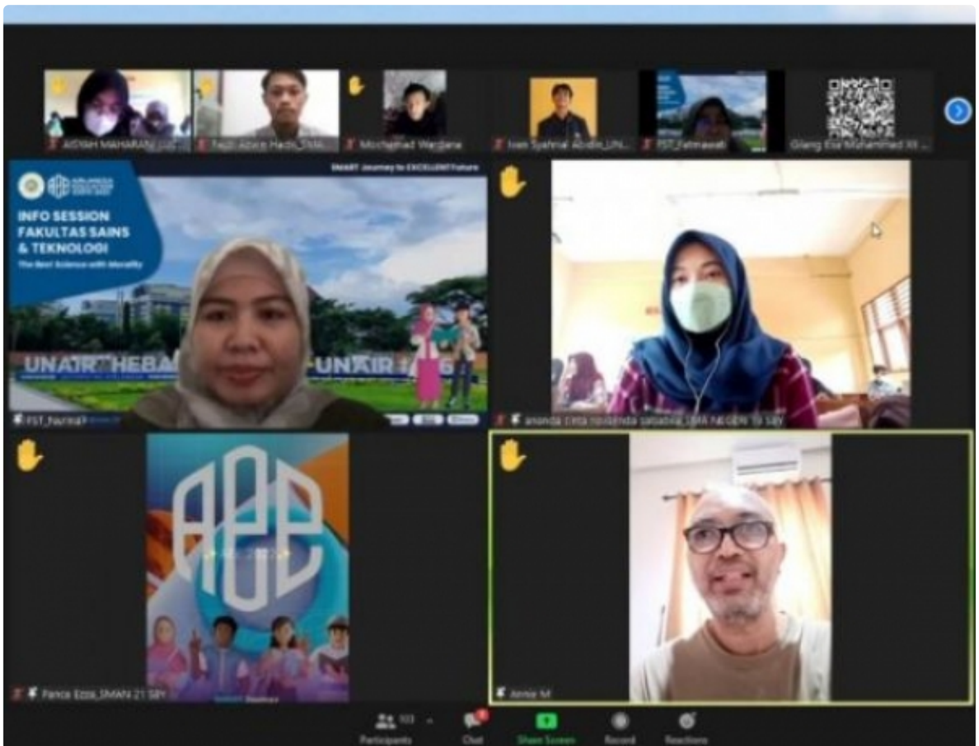
Sesi Tanya Jawab bersama FST UNAIR

SURABAYA - Fakultas Sains dan Teknologi (FST) Universitas Airlangga kembali membagikan informasi dan prestasi terkini kepada para calon mahasiswa baru. Tepatnya melalui Info Session FST UNAIR dalam Airlangga Education Expo (AEE) pada Minggu (20/2/2022) via Zoom Meeting.